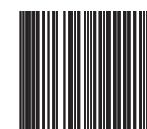
MSI Plessey 2/5 on