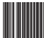
Выход без сохранения настроек