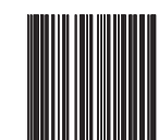
Interleaved 2/5 off