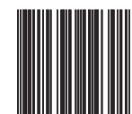
Code 39 on